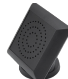
Luidspreker LS-WOK 96610167