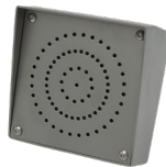
Luidspreker LP10 96610129