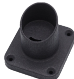
Microfoon EM-WK 96610297