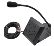
Combi LS en Mic WOK/Zw40 96610194

Wat zijn de extra mogelijkheden van de LKS 25?