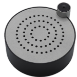
Combi LS en Mic LS-EM-R 96610130